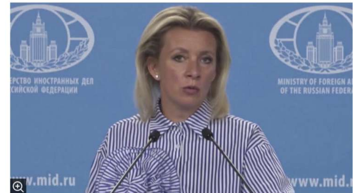
▲ 마리아 자하로바 러시아 외무부 대변인